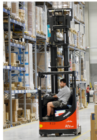
Bei jeder Abwärtsbewegung kann Energie zurückgewonnen werden, die über PowerCaps dem darauffolgenden Heben von Lasten bereitgestellt wird.